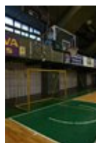
Handballtore mal etwas anders...